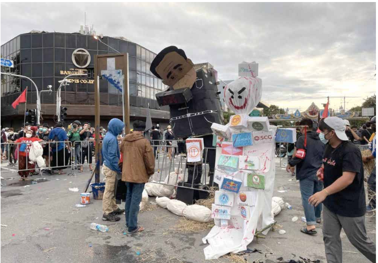
ตัวอย่างการรายงาน 18.12 แยกนางเลิ้ง ตั้งหุ่นเตรียมทำกิจกรรม #มีอบ18กรกฎา