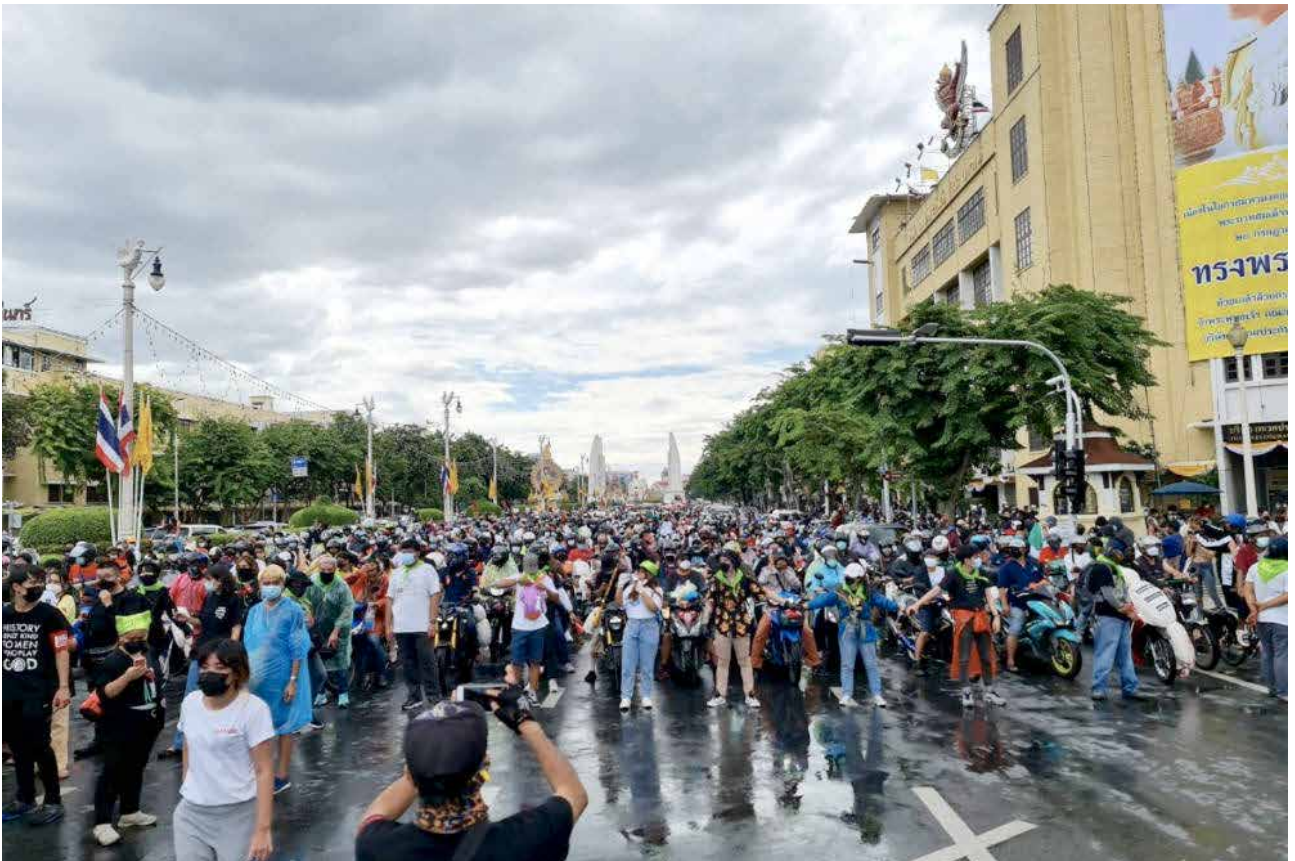
ตัวอย่างการรายงาน 15.31 แนว carmob อยู่บริเวณแยกมทากาฬ #มีอบ18กรกฎา