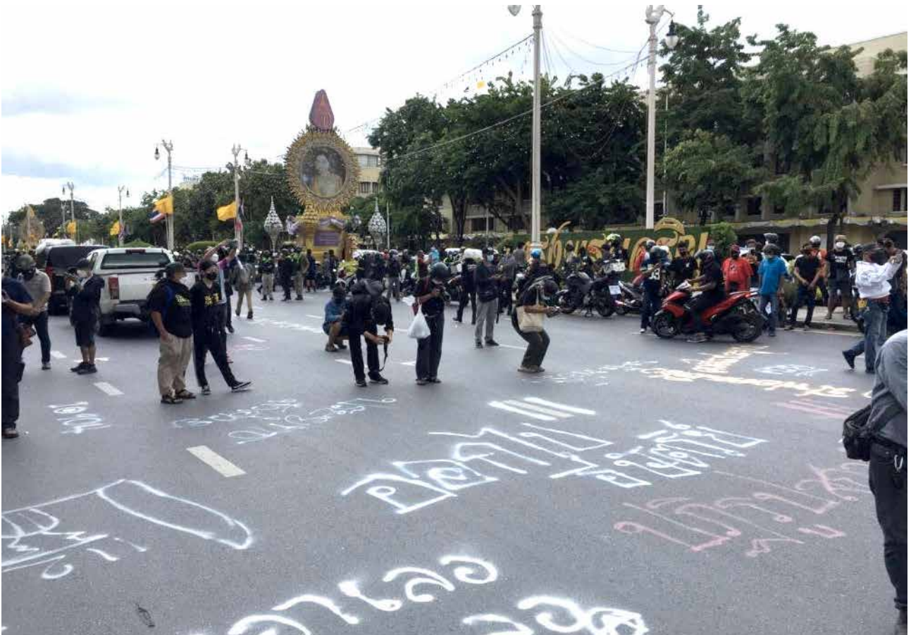
ตัวอย่างการรายงาน 14.50 ราชสติก & ราชสเปรย์ แสดงออกทางการเมืองบนถนนราชดำเนินกลาง #มีอบ18กรกฎ