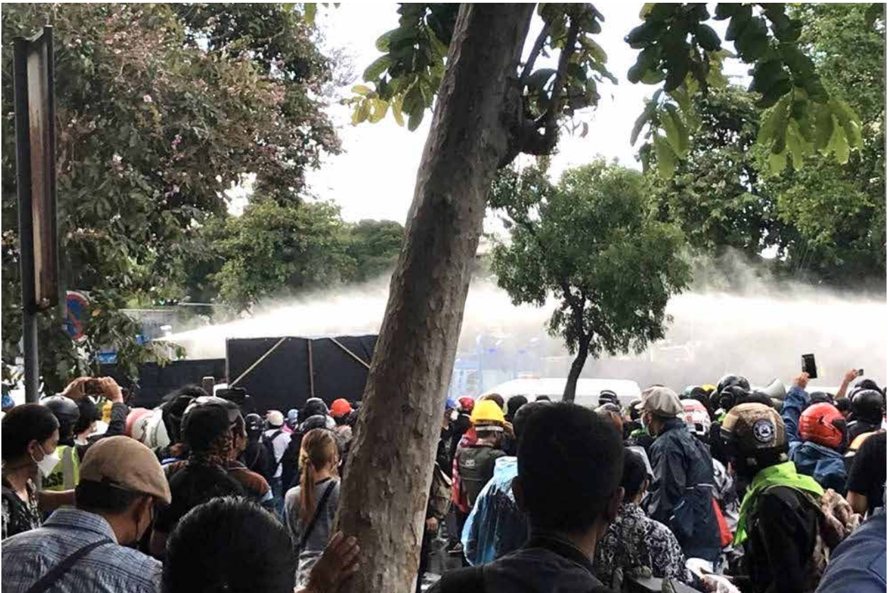
ตัวอย่างการรายงาน 16.58 เจิงสะพานขมัย ฉีดน้ำอีกครั้ง ฉีดเรื่อยๆ ฉีดต่อเนื่อง #มีอบ18กรกฎ